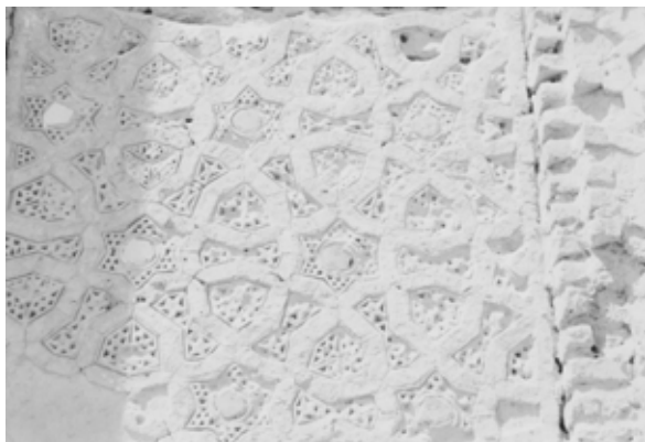
تصویر ۸: آجر کاری و کاشیکاری نگین، مقبره خواجه اتابک سلجوقی، کرمان، قرن ۵ هجری.

همچنین در این دوره، به علت ارتباط دربار صفوی با کشورهای خارجی، رونق فرهنگی و بازرگانی و آمد و شد هنرمندان و تجار از شرق و غرب، تحولاتی در نقش پردازی پدید آمد و عناصری از هنر اروپا و چین به نقوش ایرانی راه یافت. گرچه این عناصر کمابیش از دوران ایلخانی و تیموری نیز در نگارگری و بعضاً در کاشیکاری ظاهر شده بودند، اما در این زمان، رواج و تنوع بیشتری یافتند. از این نمونه ها می توان به نقش سیمرغ، اژدها، ابرهای چینی، انسان بالدار که چهار زانو نشسته (همچون شمایل بودا) و سر و نیم تنه انسان در کاشی های معرق حیاط کاروانسرای گنجعلی خان در کرمان اشاره کرد. همچنین صحنه نیزار و مرغان دریایی در حال پرواز را بر سنگ مرمر کنده کاری شده در ورودی گرمخانه حمام گنجعلی خان مشاهده می کنیم. (کرمان بر سر راه جاده ادویه که شعبه ای از جاده ابریشم بود، قرار داشت و تأثیرات هنر چین بر هنرهای این منطقه حتی قبل از دوره صفوی، آشکار است). آجرکاری، کاشیکاری نگین و معرق کاری که اوج این تزیینات در دوران سلجوقی، ایلخانی و تیموری است، در ابتدای عصر صفوی رایج بود. (تصاویر ۹ و ۸)