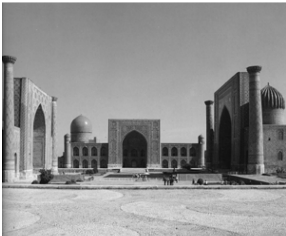
تصویر ۵: مدرسه الخ بیک سمرقند.