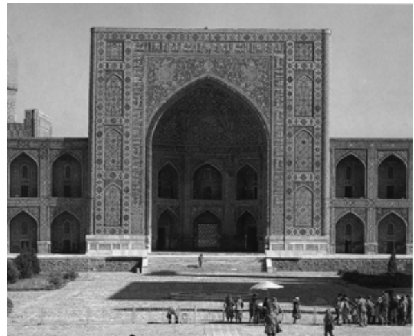
تصویر ۳: مدرسه طلاکاری سمرقند.