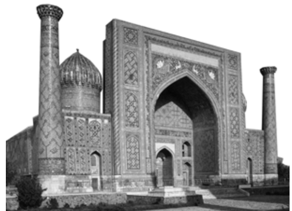
تصویر ۴: مدرسه شیردر، سمرقند.