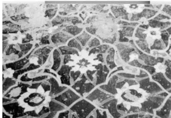
تصویر ۹: کاشیکاری معرق، قبه سبزه، کرمان، قرن ۱۷هجری.

هنر عصر صفوی هرگز از نظر کیفیت به خصوص در زمینه معماری و تزیینات با هنر دوران قبل برابری نکرد، بلکه دچار افول شد. معماری دوره صفوی اگرچه شاید فاخرترین و باشکوه ترین نوع معماری در تاریخ ایران باشد، ولی چندان نوآورانه نبود. معماران مجبور بودند وسیع ترین بناها را در کوتاهترین زمان بسازند یا تزیین کنند و بدین